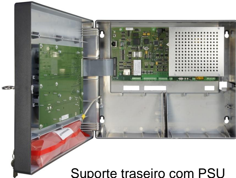
Suporte traseiro com PSU e MIC integrado