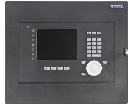
Gabinete com painel operacional